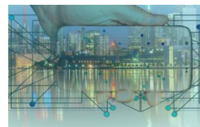
Numérisation des acteurs

Ainsi, le paysage concurrentiel va encore évoluer sans qu'on puisse le quantifier précisément avec le renforcement des positions dominantes des GAFAs, la fragilisation du business model de certains acteurs, l'émergence de nouveaux modes de consommation numérique, le besoin des clients de donner plus de sens à leurs choix.