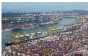
Flux physiques impactés